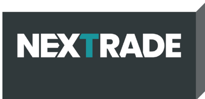
Das Nextrade-Signet auf der Ambiente .