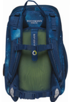
Tragesystem basierend auf einer Kombination aus Luft und Polsterung