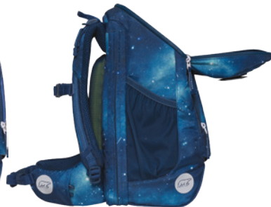
Schräge Öffnung für eine gute Übersicht