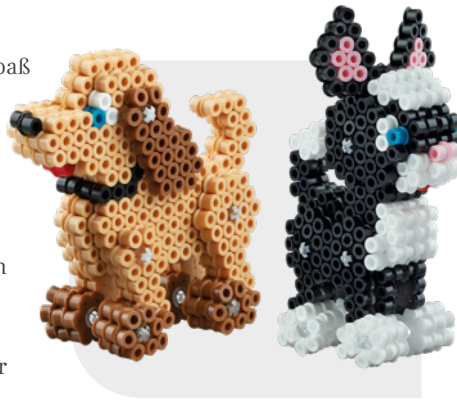
Die Lieblingshaustiere Hund und Katze als dreidimensionaler Bügelperlen-Spaß.