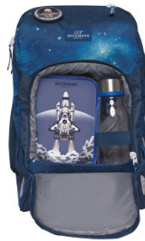
Wasserdichtes Fach für Brotboxe und Trinkflasche