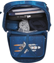
Praktische und smarte Raumaufteilung