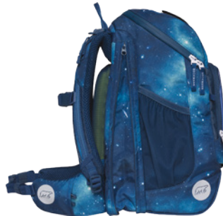
Expansion um ca. 5 Liter