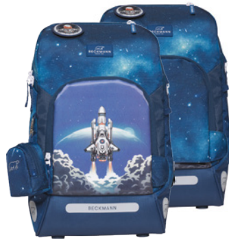
Wendetasche – 2 in 1

Der Active Air FLX besitzt hervorragende Funktionalität und optimalen Tragekomfort. Das Rückensystem basiert auf einer Kombination aus Luft und Polsterung. Dadurch wird die Luft verteilt, und es entsteht eine größere Kontaktfläche zwischen dem Schulrucksack und Rücken, was für eine bessere Stütze und Stabilität sorgt. Durch das FLX-System kann das Volumen des Rucksacks bei Bedarf um ca. 5 Liter erweitert werden.